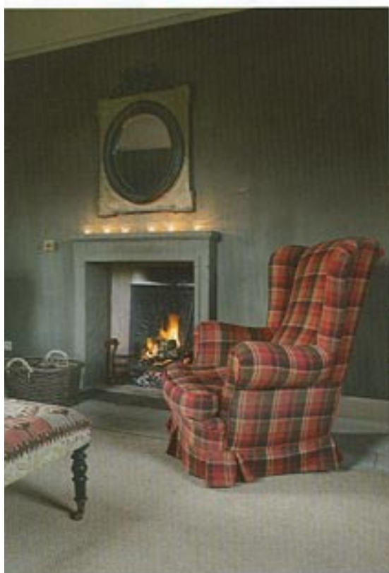
Photo à gauche : Tessa a habillé les agréables fauteuils d'une étoffe à carreaux en laine très chaude qui ressemble à une petite couverture. Une petite banquette en kelim fait office de table de salon. Elle a été fabriquée sur commande.

Avant le réaménagement, la salle des tours, qui offre une belle vue sur le jardin, était réservée à la famille. Aujourd'hui, elle fait office de sa-